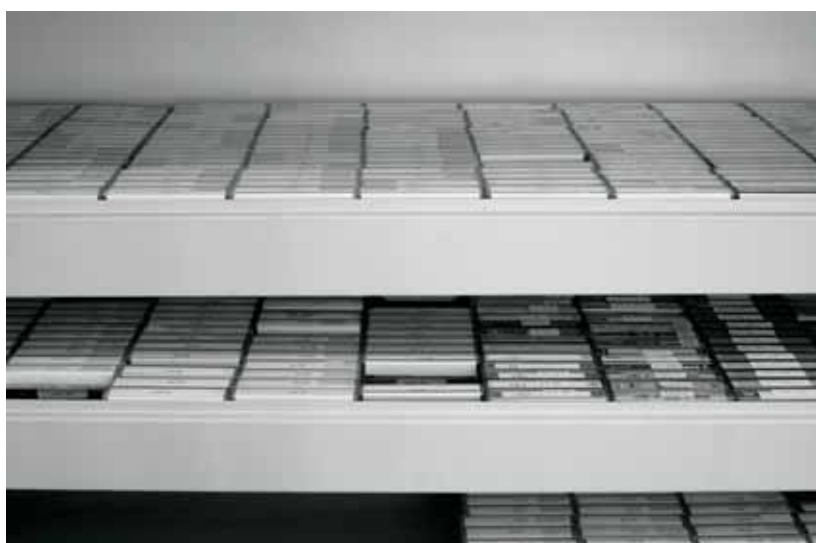
Het Archief- en Documentatiecentrum voor het Vlaams-nationalisme vzw (ADV N) bewaart naast andere audiovisuele archivalia 390 interviews die in totaal circa 600 uren beslaan. De meeste werden actief verworven binnen het project Mondelinge Geschiedenis , opgestart door een gelijknamige werkgroep in 1985. Momenteel worden eerder op occasionele basis interviews geregistreerd.

[ Roel Vande Winkel 1 ] Tussen januari en september 2004 voerde de vakgroep Nieuwste Geschiedenis van de Universiteit Gent in samenwerking met het Vlaams Centrum voor Volkscultuur het onderzoeksproject 'Van horen zeggen.' Mondelinge, historische bronnen bewaren en ontsluiten uit. Onder promotorschap van prof. Bruno De Wever en prof. Karel Velle werd, met steun van de Vlaamse Gemeenschap, een kritische bevraging ondernomen naar de huidige expertise betreffende de productie,