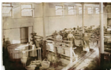
Buanderie 1899, Familistère de Guise

"Ne pouvant faire un palais de la chaumière ou du galetas de chaque famille ouvrière, nous avons voulu mettre la demeure de l'ouvrier dans un palais, le Familistère, en effet, n'est pas autre chose, c'est le Palais Social." JBA Godin