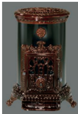
Grand Godin Oval (9,5 KWh)

Drieëntwintig is Godin wanneer hij in 1840 een nieuw procédé op basis van gietijzer in de aanmaak van verwarmingstoestellen bedenkt. Tot dan werden kacheltsjes in plaatijzer geconstrueerd. In een vooruitziende bui neemt hij een patent op zijn uitvinding, het begin van zijn industriële en commerciële opgang. Het belet evenwel niet dat veel van zijn toestellen ongestraft nagebootst worden. De gietijzeren kacheltsjes zijn immers enorm zuinig en renderend. De befaamde 'Petit Godin' wordt voor het slapengaan nog