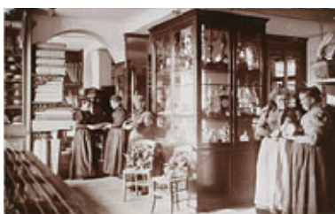
Mercerie 1901, Familistère de Guise