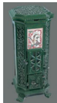
Belle Epoque (7,3 KWh)