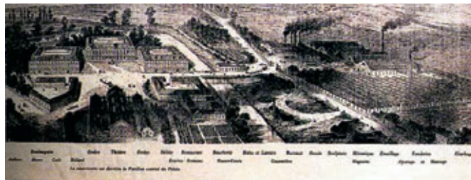
De Familistère op een oude prentkaart

Godin was wat ontgoocheld want hij had getracht zijn fabrieksarbeiders aandeelhouders – ook in de winst – te maken en hen zo te betrekken in het beheer én van de fabriek én van de Familistère. Maar hij moest zijn radicale stellingen matigen. Toch blijft deze stichting tot 1968 – net dat jaar – functioneren, maar wordt dan opgedoekt. De appartementen worden verkocht, de fabriek wordt tweemaal overgenomen en de stad Guise – de vroegere vijand – wordt eigenaar van theater, school, winkels en ontspanningscomplex. Het eenheidsgevoel is verdwenen en de Familistère bloedt dood. Nu is er opnieuw aandacht voor de Familistère Godin. Een comité ijvert voor het instandhouden van dit bouwkundig en geestelijk erfgoed. Een museumpje en een documentatiecentrum werden opgericht. Colloquia, boeken, ... bestuderen het 'Godinfenomeen'. Eén appartement evoceert de tastbare leefomstandigheden van toen. Godin komt er – bijna – weer tot leven.