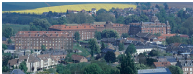
Het Familistère nu

De Familistère van Godin in Guise kan je nog bezoeken. Guise is te bereiken via de snelweg naar Parijs. Afrit Saint-Quentin (sud) en dan de richtingaanwijzers Guise volgen. Het comité wil graag vooraf een telefoontje: T 0033 3 23 61 35 36 . Er zijn enkele boeken verschenen over Godin en zijn gedachtegoed, weliswaar in het Frans: Jean-Baptiste Godin, le Familistère de Guise ou les équivalents de la richesse , een uitgave van 'Les Archives d'Architecture Moderne' in Brussel. En er is ook: Le familistère Godin à Guise. Habiter l'Utopie, Penser l'Espace , een uitgave van 'Les Editions de La Villette' in Parijs. Zie ook eens de volgende sites, ter aanvulling van de al eerder genoemde: www.sciencesociales.ens.fr/hss2001/logement/realisations/familistere.rtf , http://perso.wanadoo.fr/familistere.godin/ en www.crefige.org/recherche/histo_compta/capron.pdf .