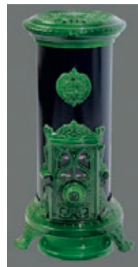
Grand Godin Rond (10,3 KWh)