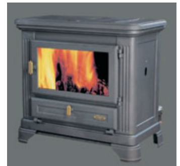
Jurassien (12,3 KWh)

even opgepookt en gloeit 's ochtends nog steeds. Vanaf 1846 vestigde de dynamische patroon zich in Guise, waar op dat moment 735 stoofjes per jaar gefabriceerd werden. Vier jaar later bedroeg de productie al ruim 100 stoven per dag. Godins creativiteit en werkkraft leken onuitputtelijk. Niet enkel technische verbeteringen maar ook een fraaie decoratie dankzij een nieuwe emailtechniek ontsproten aan zijn brein. Kacheltsjes en kookformuizen van het merk Godin ontbraken in geen enkel Frans – en Belgisch – huis. Rond de eeuwwisseling stonden de Godin-fabrieken aan de wereldtop wat betreft huishoudapparaten en