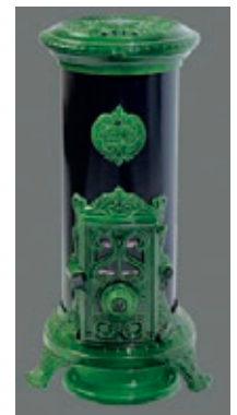
Petit Godin Rond (5,9 KWh)