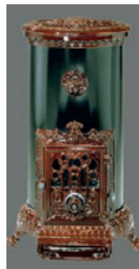
Petit Godin Oval (7,3 KWh)