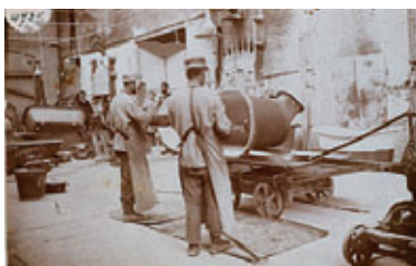
Emallage usine en 1899, Familistère de Guise

kaderleden van het bedrijf. Onder het motto 'Eigendom is diefstal' kon soepel worden ingespeeld op familiale en andere omstandigheden en konden de bewoners gemakkelijk verhuizen. Jonge koppels kregen de bovenverdieping toegewezen. Bejaarden hoefden geen trappen meer te lopen en kregen het gelijkvloers toebe-