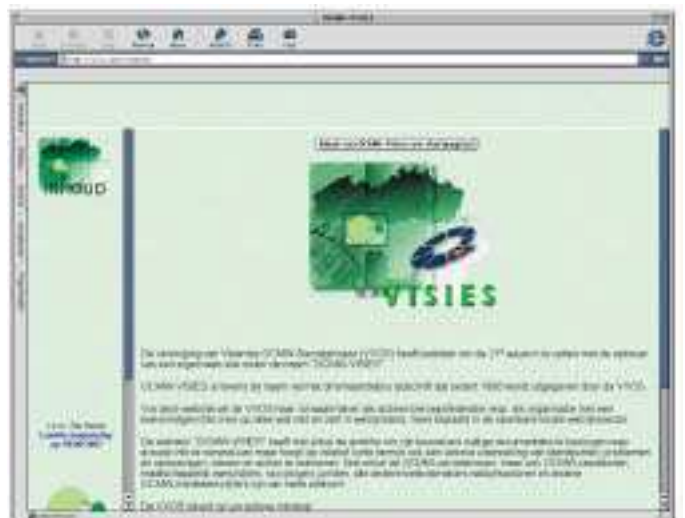
Via OCMW-Visies krijgt u een actueel overzicht van de landelijke OCMW-werking

Waar armoede bijna een element van fatalisme was in de Middeleeuwen - wie arm geboren werd, bleef arm - is dit nu een oplosbaar probleem door de zorgomkadering van het OCMW en al zijn diensten. Kansarmoede zou tot het verleden moeten behoren in een rijk gewest als Vlaanderen.