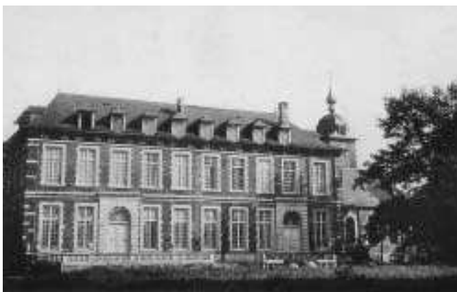
De abdij van Kortenberg, waar in 1302 de bedelaars aanschoven langs de Bedelaarsweg

'Als het arbeiderskind ter wereld komt, waakt het werk van het moederschap aan zijn wieg. Zodra het enkele stappen kan doen, neemt het werk van de bewaarscholen hem bij de hand, tot wanneer de jongen toevertrouwd wordt aan het werk van de vrije scholen, dat achteraf beroep doet op de goede zorgen van het patronagewerk (voor de ontspanning) en van het werk der arbeidersverenigingen. Als hij zich aan een vrouw wil binden, komt het werk van de H. Fransiscus Regis hem ter hulp; moet hij het uniform aantrekken, dan komt het werk van de militairen hem met open armen tegemoet. Overvalt de ellende hem, dan komen de confraters van de H. Vincentius hem bezoeken.