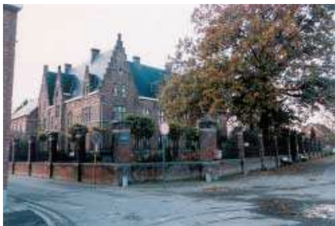
Het rusthuis Relegem te Zemst

werkman of dagloner; vervolgens de pachters van de graaf; daarna de bejaarden uit de omgeving van het kasteel van Relegem en het dorp van Zemst en ten slotte de andere inwoners.