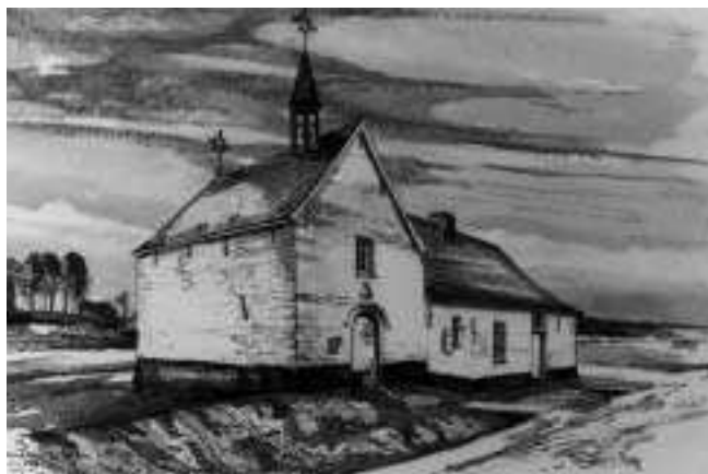
De lazaruskapel en het melaatsenhuis van Rumst