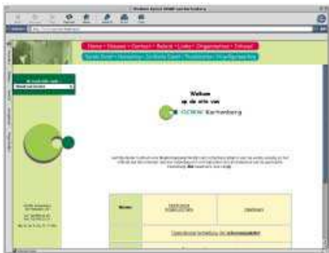
Het digitaal loket van het OCMW-Kortenberg ( www.ocmwkortenberg.be )

oplossing zijn. Ook andere problemen duiken op zoals een eventuele vergoeding voor schuldbemiddeling. Bij de meeste OCMW's is er een gratis collectieve schuldbemiddeling voor personen met een inkomen niet hoger dan 1.000 euro als alleenstaande en 1.500 euro als gezin. Sites van het OCMW op het internet (sommige gemeenten hebben dit reeds) en een digitaal loket zullen ook in de toekomst in alle OCMW's ingang vinden.