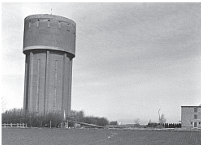
De 2e watertoren van Zaventem rond 1980.

in je gemeente' niet veel zouden opleveren. Daarom vind je in de opdrachten heel wat kleine en meestal ook zeer praktische vragen, belangrijk voor de interviews, zoals: