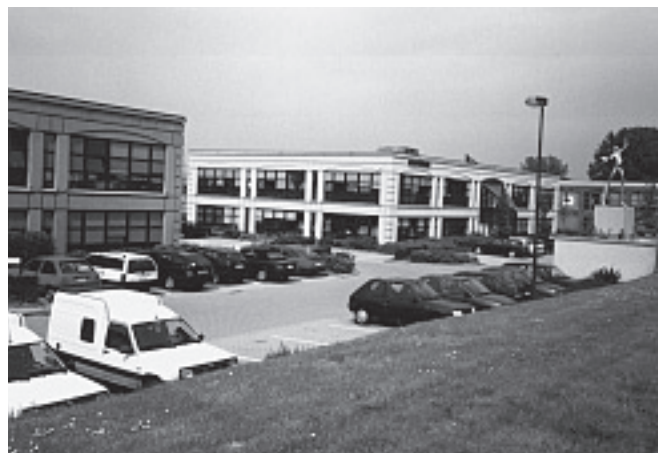
Het bedrijvenpark Icarus te Zaventem op het einde van de jaren '90

De landbouw onderging grote veranderingen in Midden-Brabant. Roger Penninckx, landbouwer te Zaventem, bezorgde ons op 7 september 1999 de volgende gegevens betreffende de zaaizaadfactor: "In 1945 had men voor 1 ha tarweland 20 kg zaaizaad nodig. De opbrengst per ha bedroeg toen 4000 kg. In 1999 heeft men in Zaventem voor 1 ha tarweland 1,3 kg zaaizaad nodig. De opbrengst per ha is nu 7000 à 8000 kg, dit laatste bij een goede oogst. De zaaizaadfactor of de verhouding tussen zaaizaad en