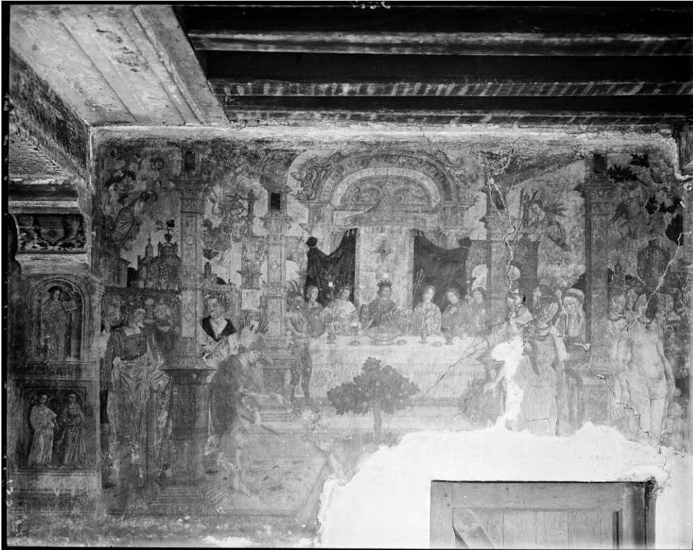
© KIK C00852 (een bijna identieke opname heeft het nummer C001393) Het festijn en de kwelling van Tantalus.