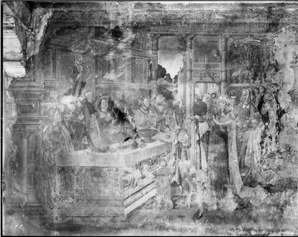
© KIK C001391 (een bijna identieke opname heeft het nummer C000853) Het festijn van Balthasar.