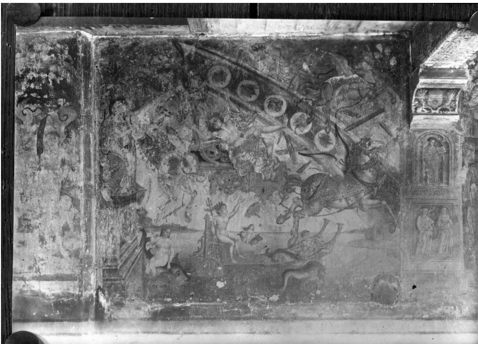
© KIK A 106963 Het document waarop de schildering met de val van Phaeton te zien is, is een foto van een foto-afdruk. De hoeken werden vastgezet met duimspijkers.