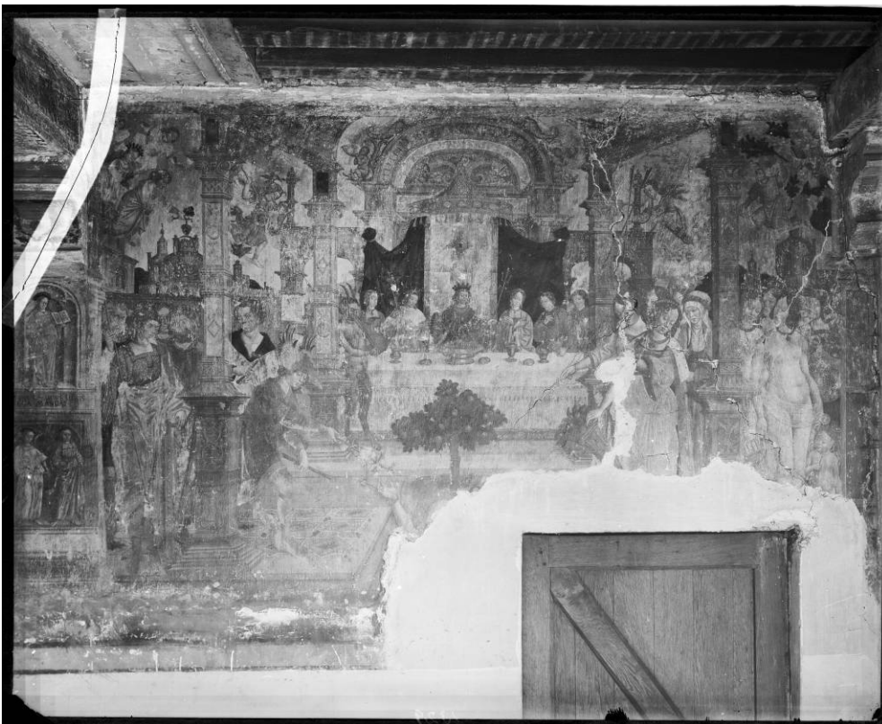
© KIK C000664 Het festijn en de kwelling van Tantalus. De glasplaat is gebroken, maar het is de enige opname die de hoekconsole rechts in beeld brengt.