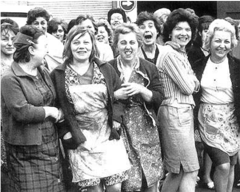
Staking bij FN Herstal, 1966