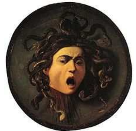
Caravaggio, Medusa, ca. 1598