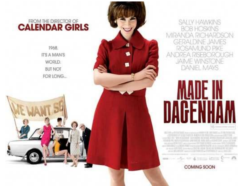
Made in Dagenham, 2010