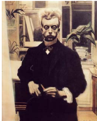
Leon Spillaert Geboren te Oostende op 28 juli 1881 Overleden te Brussel 23 november in 1946 Vlaamse symbolistische kunstschilder.