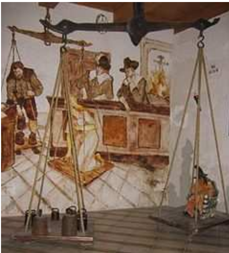
Een heksenwaag in een museum