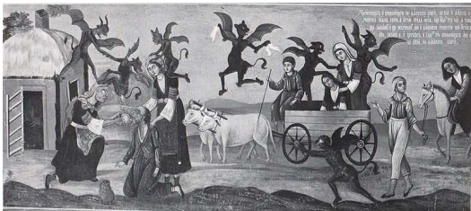
Een zieke wordt behandeld door een heks

Uit de contrareformatorische tijd vinden we relatief veel gevallen van vervolging van bijgelovige praktijken terug in de archieven van de kerkelijke rechtbank. Het gaat dan nooit om heksen, maar wel om die figuren die in de catechismus 'tovenaars' genoemd worden: de belezers en bezweerders die reeds ter sprake gekomen zijn en verder ook nog degenen die zich bezighielden met geleerde magie. De pastoor van Rijen beoefende de geleerde occultistische magie in de stijl van Agrippa van Nettesheim; hij werd in 1589 door de kerkelijke rechtbank tamelijk mild gestraft met een gedwongen verblijf van enkele dagen in een klooster, waarbij hij moest vasten op water en brood. Hij had zich laten assisteren door een vrouw, die door de gerechtsofficier voor de Bredase schepenenbank werd gedaagd. Zij