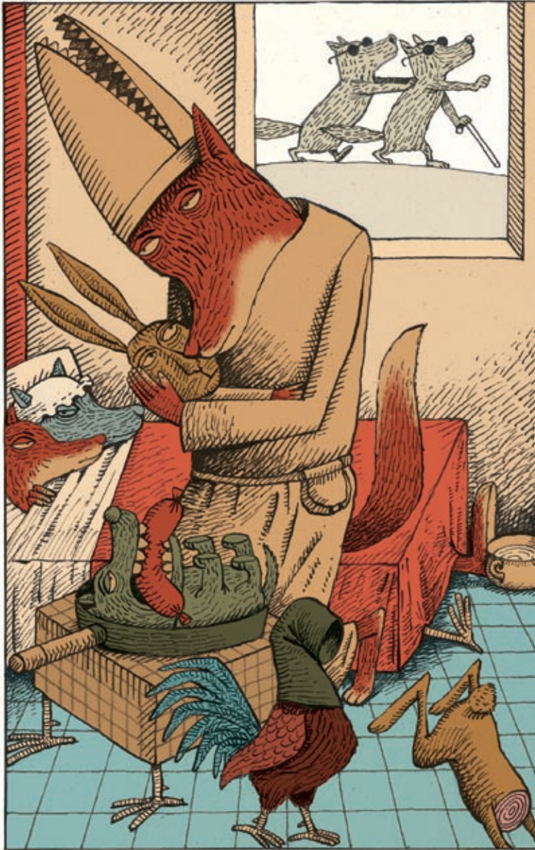
© illustratie Klaas Verplancke / www.klaas.be

is geobsedeerd door raadsels en puzzels, en een vaste vijand van Batman. Hij draagt meestal een groen kostuum met een bolhoed of een spandex pak)? Wat maakt hem succesvol als schurk? Wat zou het verhaal zonder hem zijn? Bij wie hoort hij? Wat vertelt het samenspel tussen the Riddler en Batman over hen beiden? Wat voor soort schurk is The Joker (Joker is een fictieve superschurk uit de strips van DC Comics. Hij is een psychopaat met een clownachtig uiterlijk: een witte huid, groen haar, en altijd een glimlach op zijn gezicht. Hij wordt beschouwd als Batmans grootste tegenstander.)? Wat maakt hem succesvol als schurk? Wat vertelt het samenspel tussen the Joker en Batman over hen beiden? Maak twee kolommen met eigenschappen van the Joker en Batman? Welk spel wordt hier gespeeld? Wat zegt the Joker in The Dark Knight (film van Christopher Nolan uit 2008) over Batman? ('You complete me!')