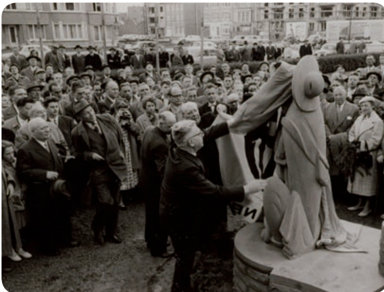
Inhoudiging van Reynaertbank in 1958 © Bibliotheca Wasiana Inhoudiging van Reynaertbeeld in 1958 © Bibliotheca Wasiana