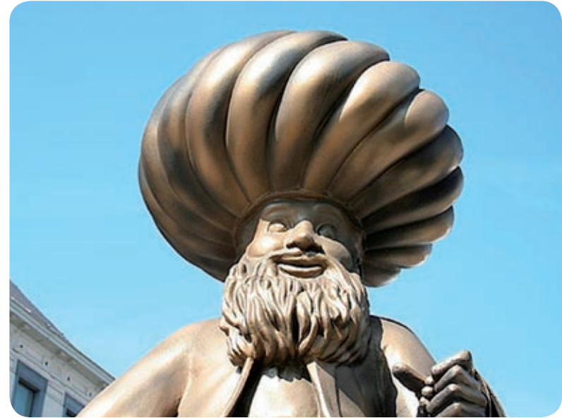
Standbeeld van Hodja in Schaarbeek

De Hodja ging naar buiten en haalde de kat, een heel jong en klein dier. Hij pakte een weegschaal, woog de kat en riep luid: