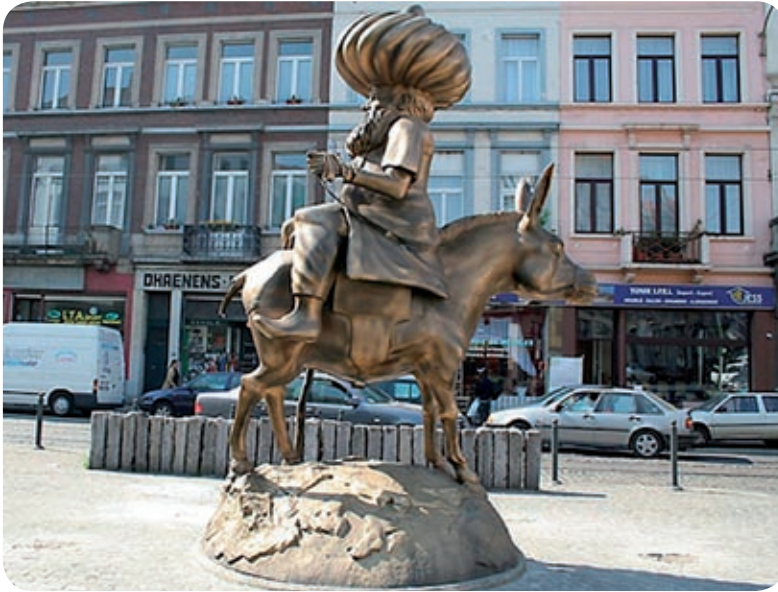
Standbeeld van Hodja in Schaarbeek

Hij overleed in Konya. Anatolië, de streek waar hij leefde, kwam in de 13de eeuw, ook de eeuw van Nasreddin Hodja, definitief in Turkse handen. Nasreddin Hodja was in zijn tijd een vooraanstaand man. Hij had invloed op de rechtspraak en deinsde er niet voor terug kritiek uit te oefenen op bewindvoerders. We moeten er wel bij vermelden dat de oudste bron over Nasreddin Hodja uit 1480 dateert, twee eeuwen na zijn dood.