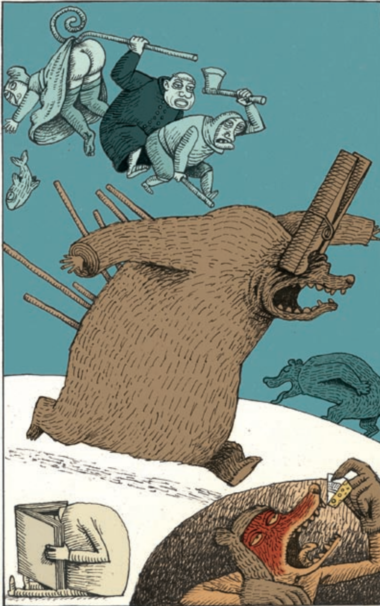
© illustratie Klaas Verplancke / www.klaas.be