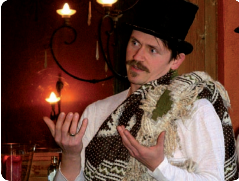
Meneer Zee vertelt Anansi

blijkt vol met de lekkere vruchten te zitten die Anansi kocht met het gekregen geld. De mensen zijn zo kwaad dat ze de vruchten in stukken snijden en alle kanten op gooiden. Zo komt het dat ze over het hele grondgebied van de stam verspreid zijn.