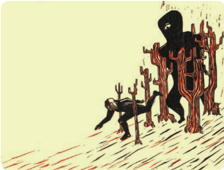
Anansi en de dood © Illustraties Joris Ongena

en zijn de verhalen 'gekuist'. Er is sprake van verburgerlijking en vertrutting. Volgens sommigen verliest Anansi zijn 'giftige' trekjes en wordt hij meer een vrolijke grappenmaker.