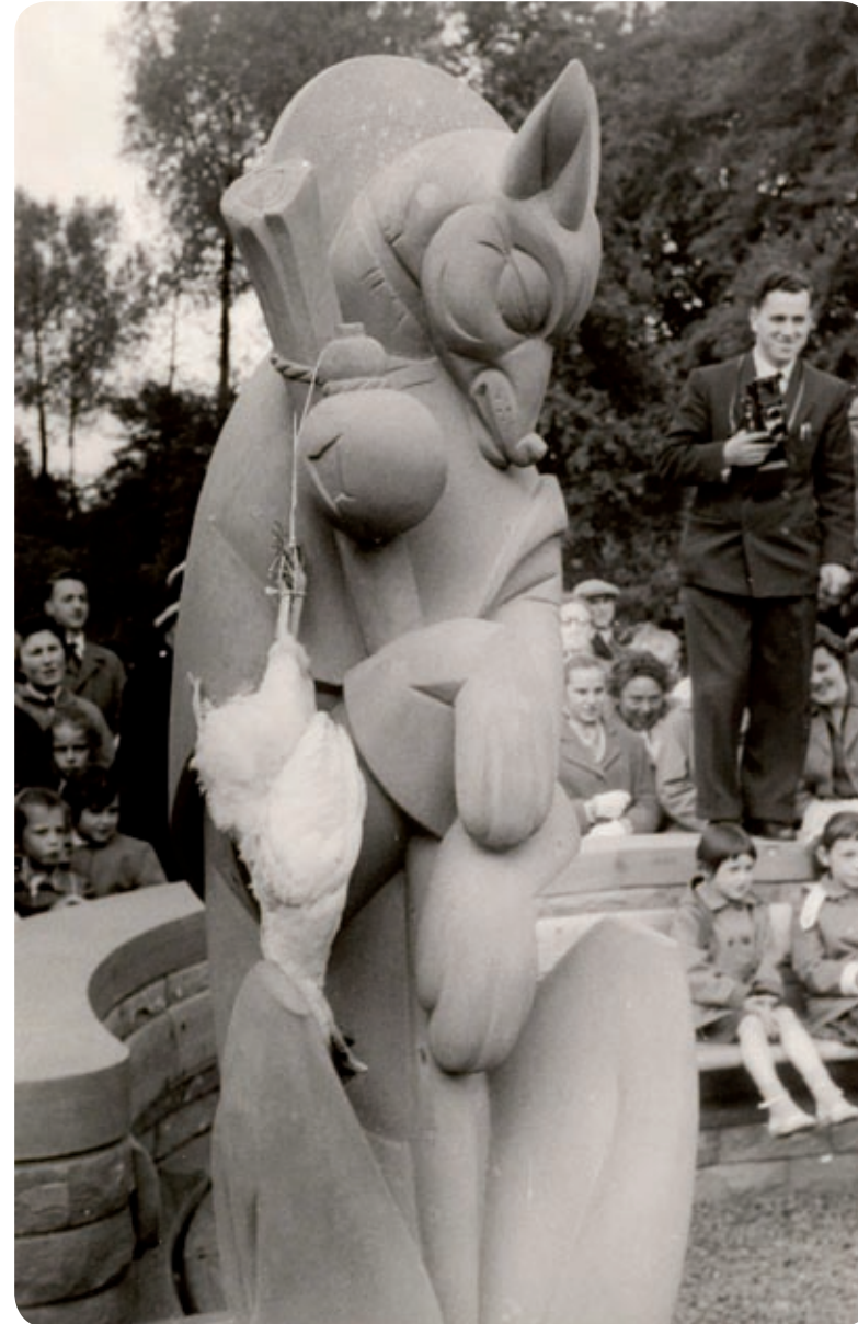
Inhoudiging van Reynaertbeeld in 1958