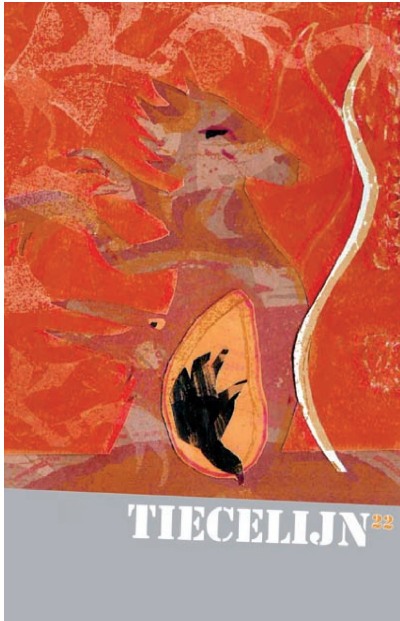
Cover van Tiecelijn 22 over Tricksters © Illustratie Lies van Gasse