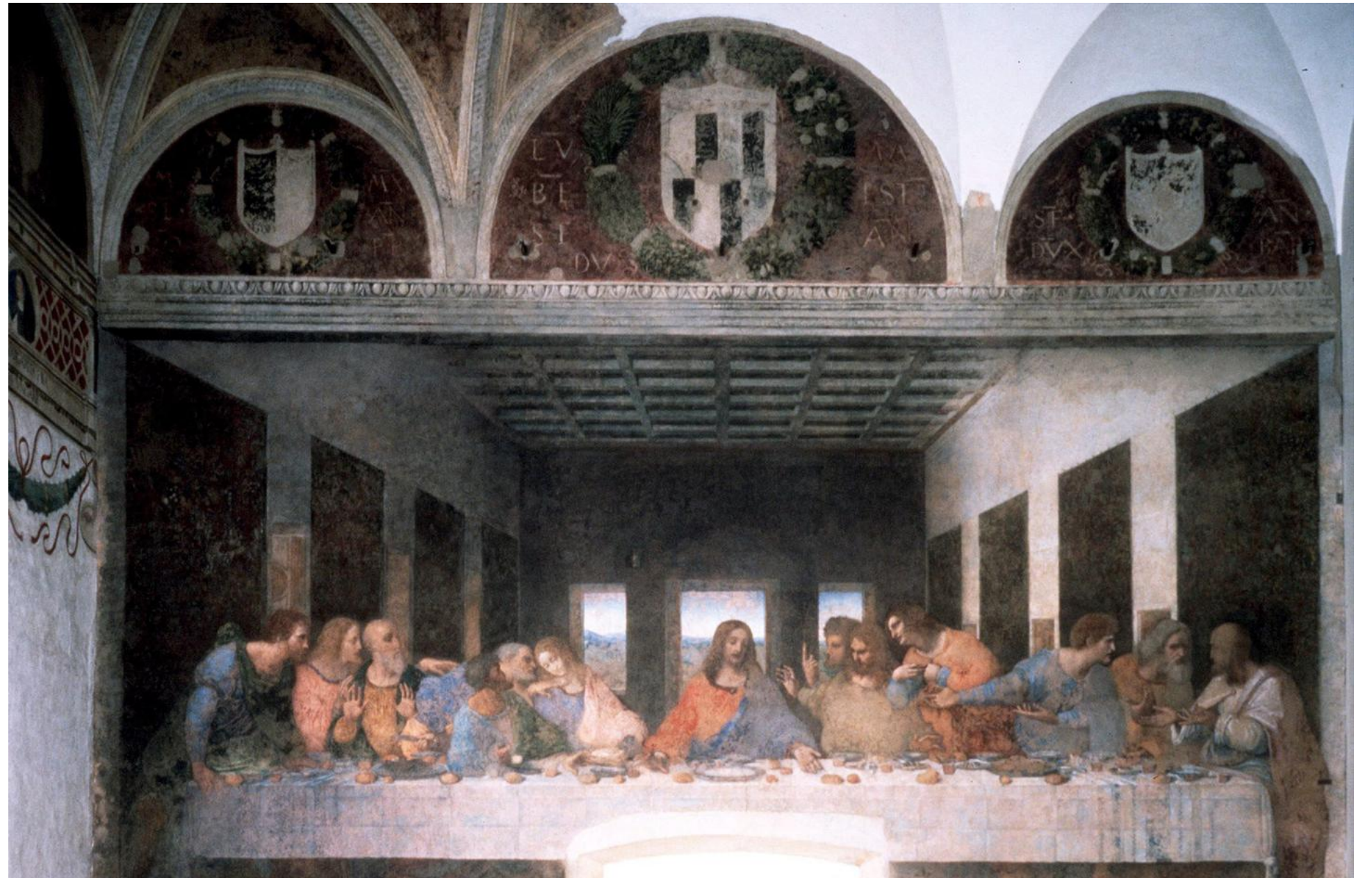
'Het Laatste Avondmaal' in Milaan: bijna een ruïne.

do en Het Laatste Avondmaal waarschijnlijk met plezier lezen. De auteur, Ross King, verstaat de kunst om uit het slechts voor specialisten toegankelijke materiaal van de kunstgeschiedenis bestellers te maken. Ook over het ontstaan en het verval van Leonardo's meesterwerk vertelt hij een boeiend verhaal vol kleurrijke details, dat bovendien een beeld geeft van het leven en de politieke intriges in het vijftiende-eeuwse Italië.