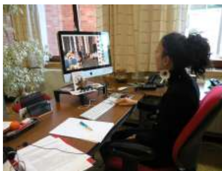
Werkdag: jongeren uit Vlaanderen en russel gaan een dagje werken