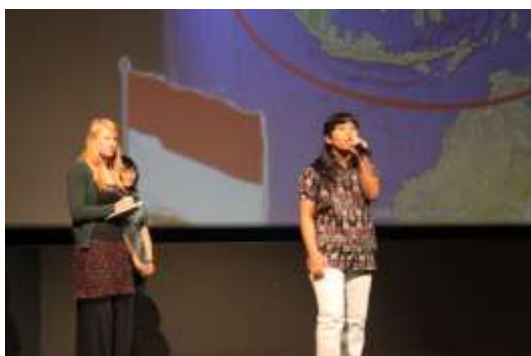
Educatie: jongeren uit het Zuiden vertellen hun verhaal

Zuiddag is een vernieuwend campagnemodel waarin educatie en fundraising op een originele manier aan elkaar gekoppeld worden. Belgische 15-20 jarige scholieren (BSO, KSO, TSO, ASO en BuSO) gaan tijdens de schooluren één dagje werken en staan hun loon af aan een jongerenproject in het Zuiden . Vooraf maken ze kennis met de leefwereld van hun Zuiderse leeftijdsgenoten die in België een toer doen in de Vlaamse scholen en steden. Leerkrachten en leerlingen krijgen een educatieve lesmap, een jongerenmagazine en een film ter verduidelijking van het jaarlijks verkozen project en thema.