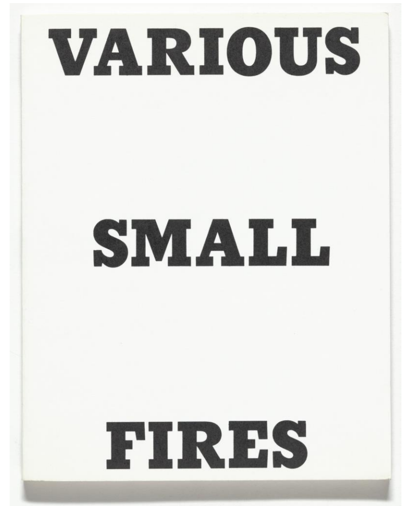
Ed Ruscha, Various Small Fires and Milk (1964-1970) Collectie M HKA, schenking van Stichting Gordon Matta-Clark

Ook ontbrak bijna elke informatie in verband met de schenkingscontext en de tentoonstellingsgeschiedenis van de werken.