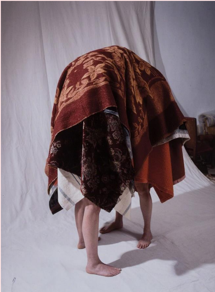
Berlinde De Bruyckere, Spreken (1999)