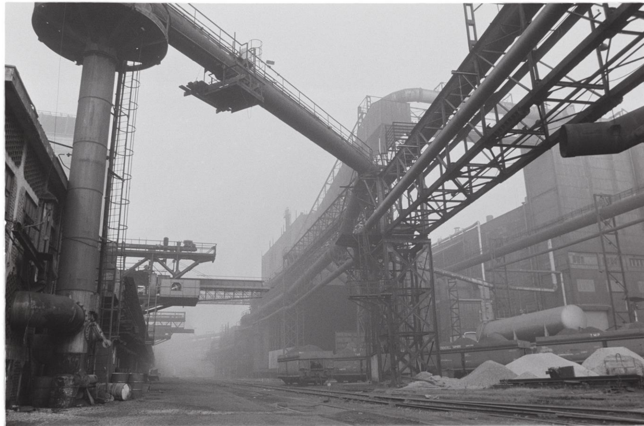
Staalfabriek La Providence in Charleroi, 1986