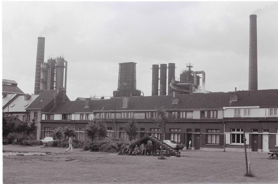
Staalfabriek Forges de Clabecq in Vilvoorde, 1986

Januari 2021 tot december 2023 - Resultaten